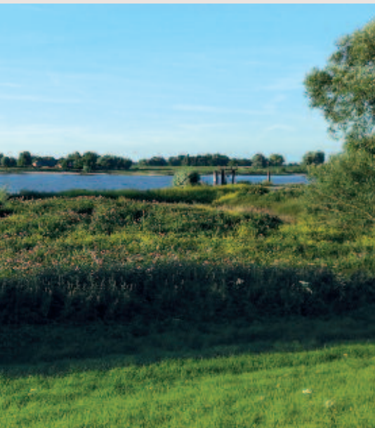
Foto 4. Groei van reuzenbalsemien door onvolledig verwijderen van plantenmateriaal na maaien van bronbeekoevers in Beek-Ubbergen.

Momenteel is onvoldoende informatie beschikbaar over de effectiviteit van biologische bestrijdingsmethoden van uitheemse springzaden (Matthews et al., 2015). De eerste veldexperimenten voor bestrijding van reuzenbalsemien met